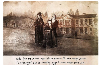
דמינן פנימא איהו על קיימא פון אה אנה בייחוד פיר טון באות אין דיין פיר חייב זי זעקן זינאיי וז נא אונטערשטעלען

כבר דיברנו הגליונות הקודמים על הפלגת אהבת רבנו לתורת ד' ית"ש אבל רצוננו לצרף לזה רק שני נקודות והוא מש"כ באגרות רבנו זצ"ל שמברך שם את מקבל מכתבו שיזכה "לחבק את התורה". וז"ל שם [אגרת קס"א] -