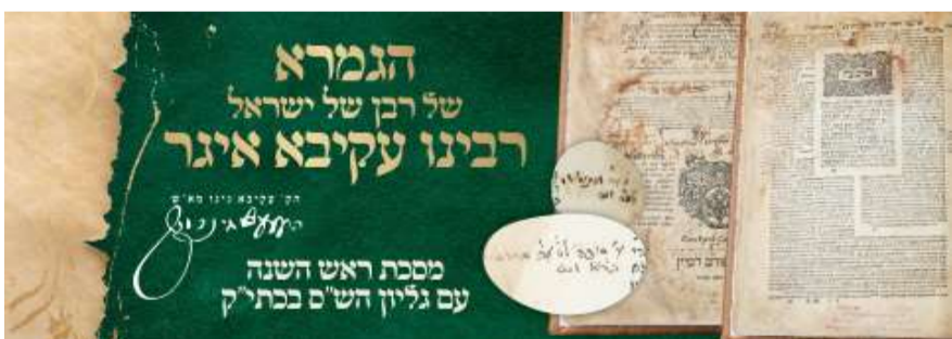
מסכת ראש השנה שלמד בו רבנו זצ"ל ורשם בה הגהותיו

ונשמח לבשר לציבור הקוראים של גליונינו שבימים אלה ממש התגלה כמה וכמה מסכתות של התלמוד בבלי שבו למד רבנו זצ"ל ויש שם אולי כמה הגהות על הגליון שאינם כתובים בגליוני הש"ס הנדפסים המצויים [וכמה תמונות יש כאן בצד הגליון] וכמו כן התגלה [היה במכירות הפומביות לפני כמה שנים ועכשיו חזר לשם] הספר החשוב "בתי כהונה" עם גליונות של רבנו זצ"ל. רבנו זצ"ל מציין לספר החשוב הזה בהרבה מקומות כמן בגליון הש"ס [שבת כ"א ב'] ובעוד מקומות ולעיל במדור "הלכה כרבי עקיבא" הבאנו אחד מהמקומות שרבנו זצ"ל מציין להם.