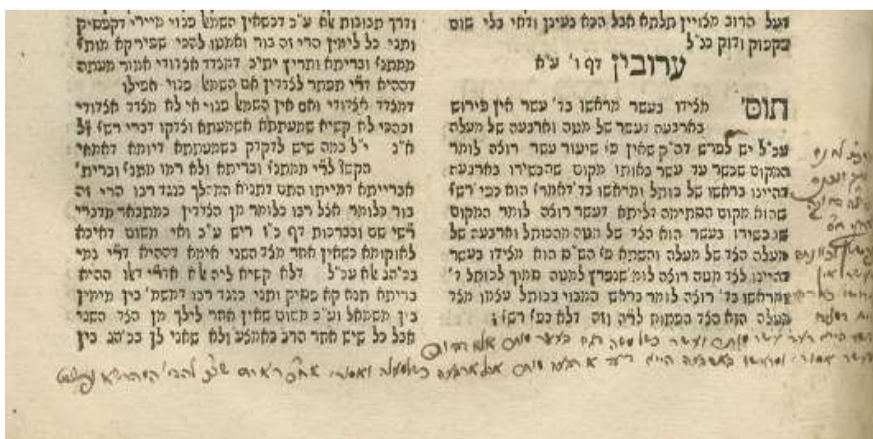
גליוני רבנו על ספר בתי כהונה